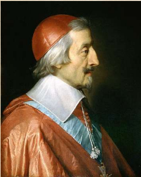
Le Portrait du cardinal Richelieu, Philippe de Champaigne, 1642

De son vrai nom Armand Jean du Plessis de Richelieu, ce personnage célèbre dans l'histoire fut tout d'abord remarqué par Henri V, avant de devenir le premier ministre de Louis XIII. C'est un homme sérieux, guidé par la raison, et animé par le désir de renforcer le pouvoir des Bourbon. Ordonné prêtre en 1607, il est à l'origine de grandes réformes, il intervient dans tous les domaines politiques. Il incarne la raison d'État, faisant toujours passer cette dernière avant toute autre chose. Cette raison d'État a pour conséquence le rejet d'autres entités au sein de l'État, et ainsi explique la révolte des Cascavèu par exemple. Lorsqu'il meurt en 1642, il n'est pas apprécié. Néanmoins on lui reconnaît d'avoir posé les fondations de la grandeur du pouvoir français. Un autre cardinal de la même trempe lui succède : le cardinal Mazarin, ministre d'État sous Louis XIV de 1643 à 1661.